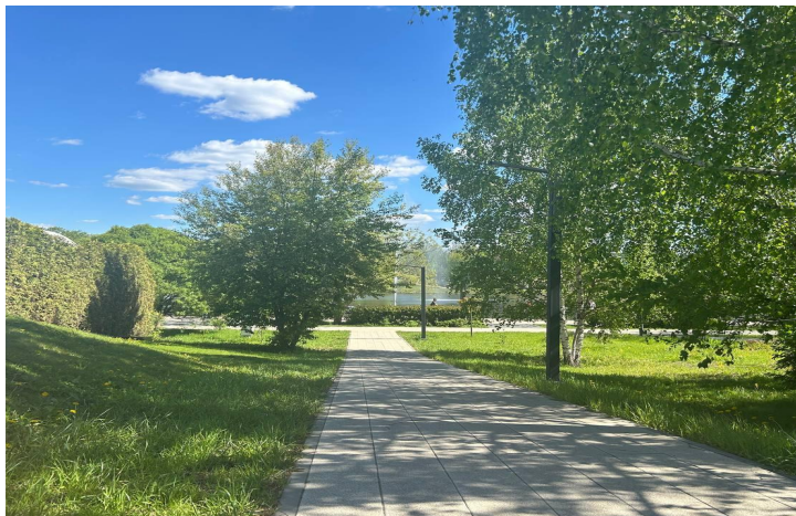
Опоры освещения СДСВЕТ

Один двор, но разные поставщики и разные стандарты качества и стиля