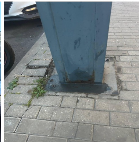
Опоры освещения другого поставщика, смонтированы в один период